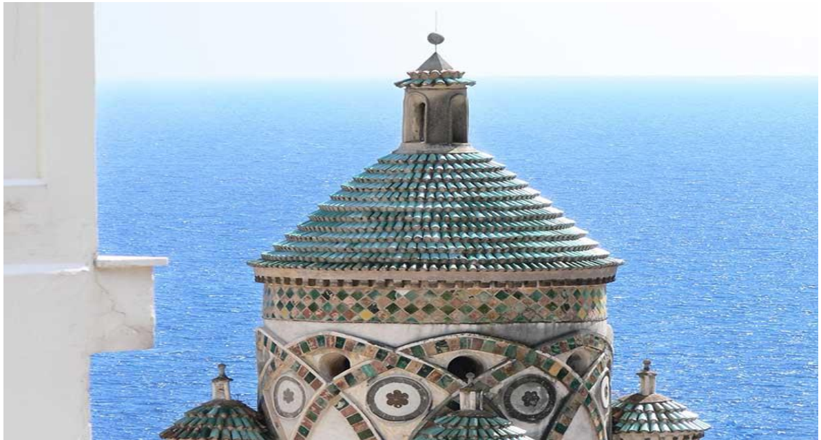
AMALFI TORRE S. ANDREA